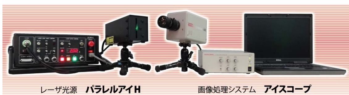
微粒子可視化システム(タイプH)