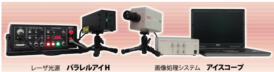
レーザ光源 パラレルアイH