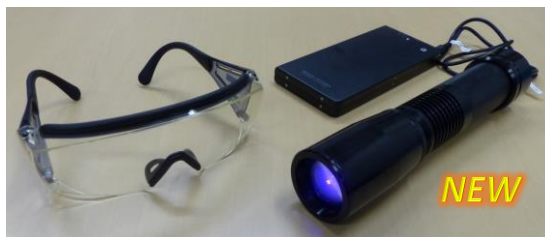
表面観察用ツール Dライト