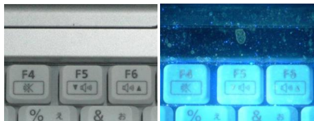
観察例：キーボードの汚れ

当社の微粒子可視化システムは、超高感度カメラと独自開発の可視化光源を組み合わせた、80ナノメートルの浮遊微粒子をリアルタイムに映像化できる世界最高水準の可視化装置です。