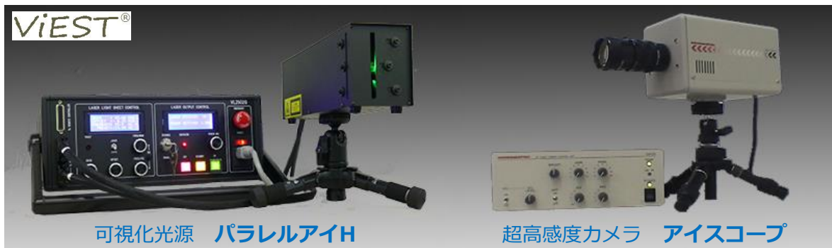
可視化光源 パラレルアイH