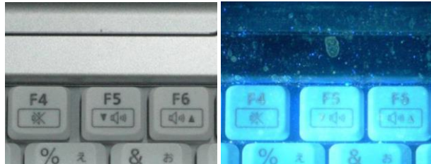
観察例：キーボードの汚れ

微粒子可視化システムは、80ナノメートルの浮遊粒子をリアルタイムに映像化できる世界最高水準の撮影感度をもった可視化装置です。国内外で、システムの販売、システムを利用した受託サービス（生産工程や製造装置内外における微粒子や気流の挙動調査、各種設備性能の評価など）を展開しています。