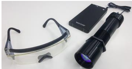
表面異物識別ツール Dライト